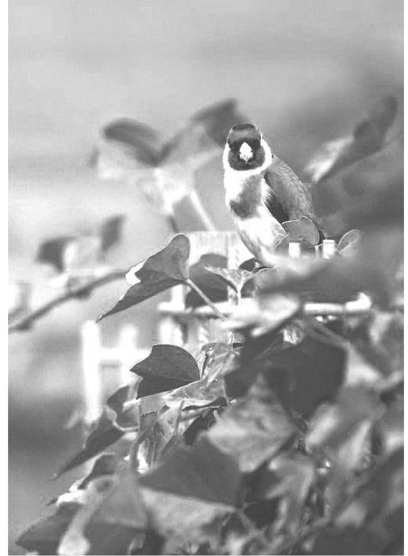
Vreemde vogel die in de tuin werd aangetroffen tijdens het schoonmaken van de racefiets.